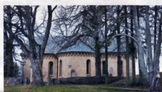
Äldre. För några år sedan visade utgrävningar vid kyrkan att kristendomen och träkyrkan som fanns i Heda var 100 år äldre än man tidigare trott.