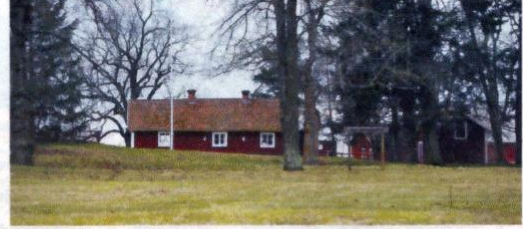
Pesten. Här på "Likbacken" går marknadsbesökarna varje år. Här är troligen alla offer efter pesten i Heda begravda.